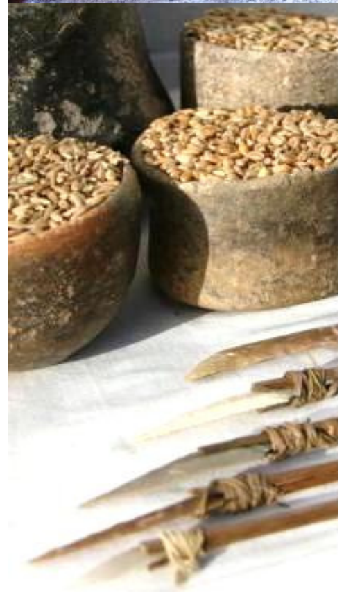
Monumento megalítico Anta da Arquinha da Moura, freguesia da Lajeosa do Dão. Corredor de acesso à câmara | Espólio exumado